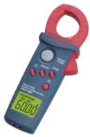
三和電気計器(株) クランプメータ DCL31DR

測定記録支援システム「BLuE（ブルー）」は、無線通信（Bluetooth等）で繋がった測定器から送信されてくる測定値を、PDF図面やExcel帳票へダイレクトに入力することができるソフトウェアです。